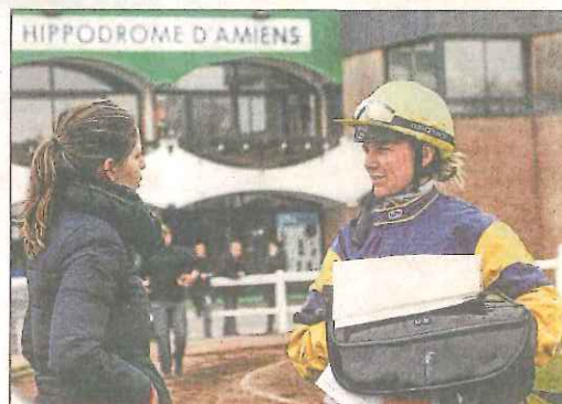
Echanges avant la course.