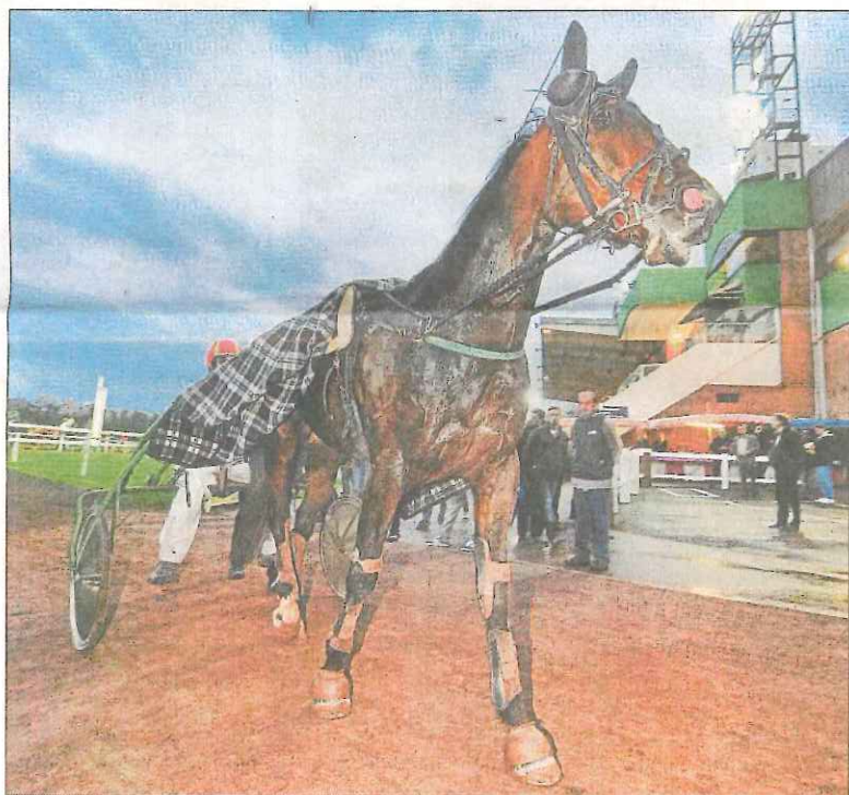
Cheval après l'effort.

200 photos envoyées, 30 sélectionnées (dont une partie dévoilée ici et pages suivantes) et trois qui seront primées ce mercredi. Un regard pluriel de grande qualité sur l'hippodrome d'Amiens.