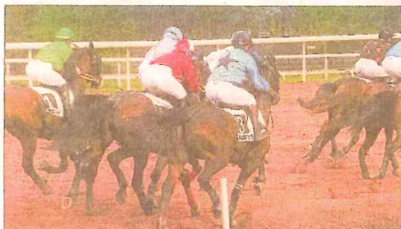
Une photo prise de la voiture suiveuse, lors d'une course de trot monté.