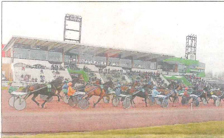
Cinq heures de spectacle sont programmées lors des courses de trot nocturnes, samedi 1 er juin.

Les dirigeants ont fait appel à plusieurs partenaires pour que la fête de l'hippodrome soit une réussite, au-delà du spectacle des courses.